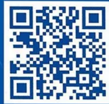
中科院之声知乎机构号