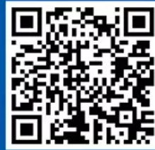
中科院之声网易号