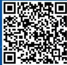
中科院之声央视频号