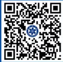
中科院之声企鹅号