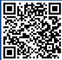
中科院之声一点号