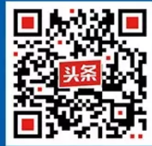
中科院之声头条号